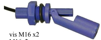
vis M16 x2 M16x2 screws